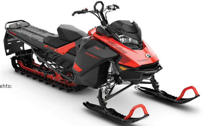
SUMMIT® SP 165 850 E-TEC® KUVASSA